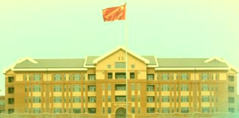
天津机电职业技术学院

TIANJIN VOCATIONAL COLLEGE OF MECHANICAL AND ELECTRICAL ENGINEERING